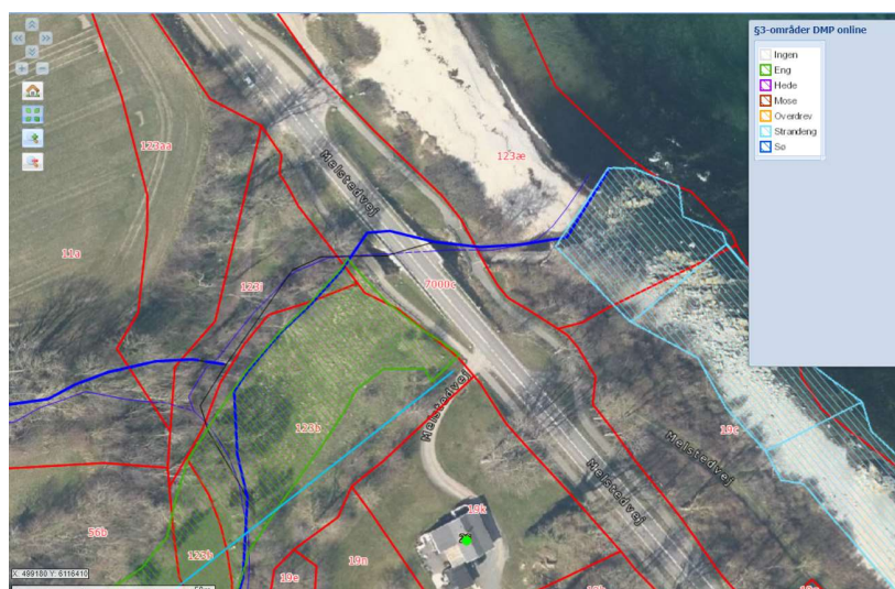
Figur 4: Matrikelkortet viser de områder, som er beskyttet af naturbeskyttelseslovens § 3 tæt på eller indenfor projektområdet.

Kobbe Å er omfattet af naturbeskyttelseslovens § 3. Projektet berører desuden en naturbeskyttet eng (figur 4). Bornholms Regionskommune har vurderet, at den del af projektet, som vedrører vandløbet, ikke kræver en dispensation fra § 3. Da ledningen skal graves ned gennem den naturbeskyttede eng har Bornholms Regionskommune vurderet, at denne del af projektet kræver en dispensation fra naturbeskyttelseslovens § 3.