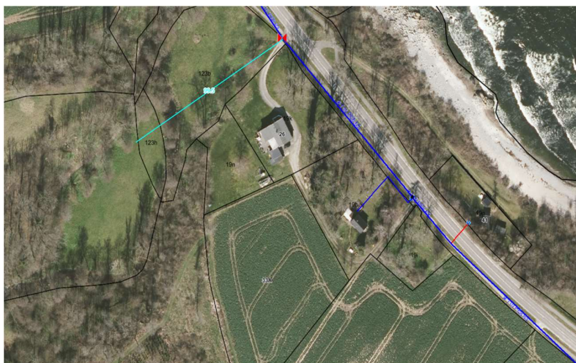
Figur 1: Satellitbillede, der viser vandledningens placering.

Placeringen af vandledningen fremgår med en turkis streg på følgende kort: