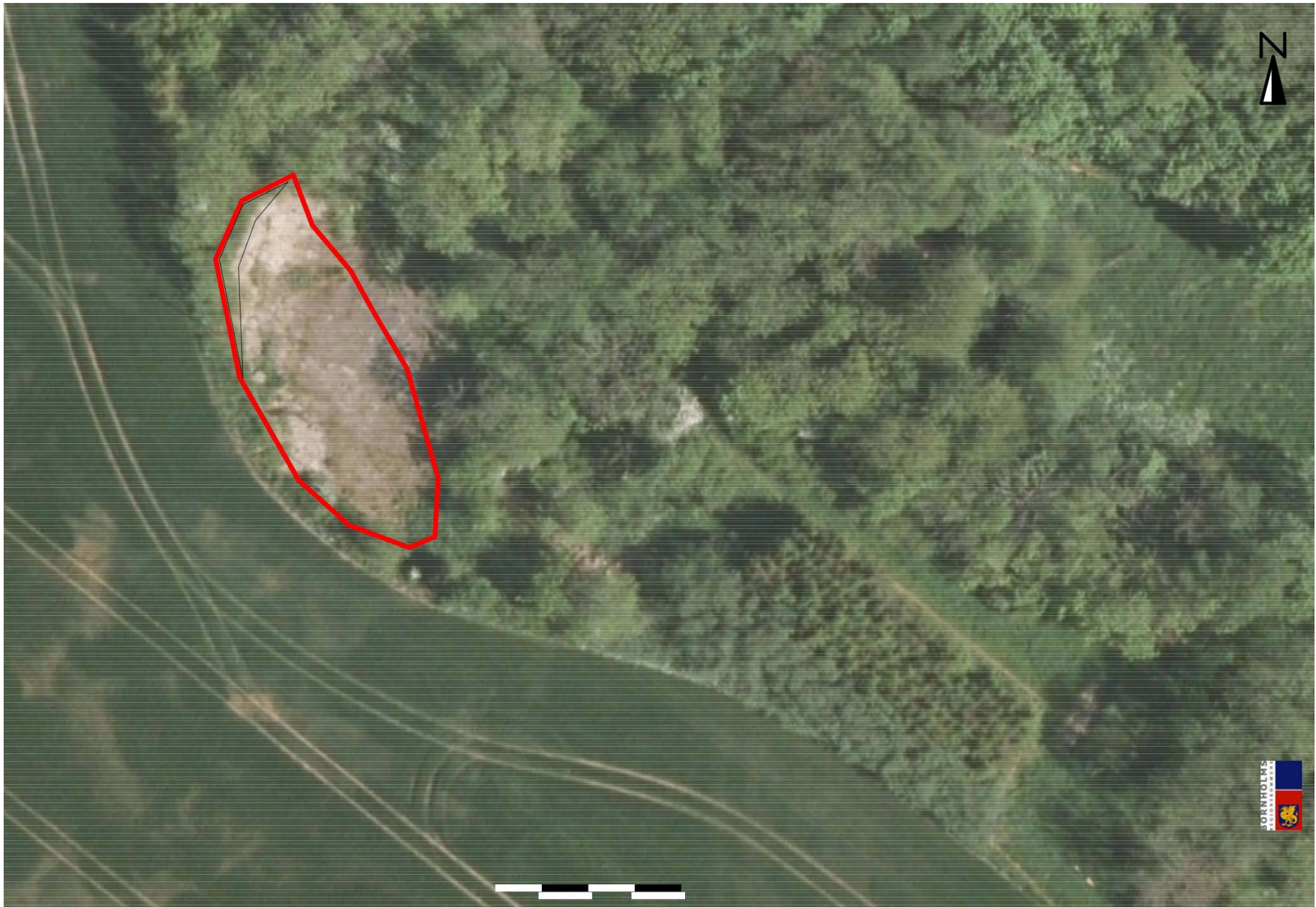
Kortbilag 1b – Brydnings- og arbejdsområde (1:500)