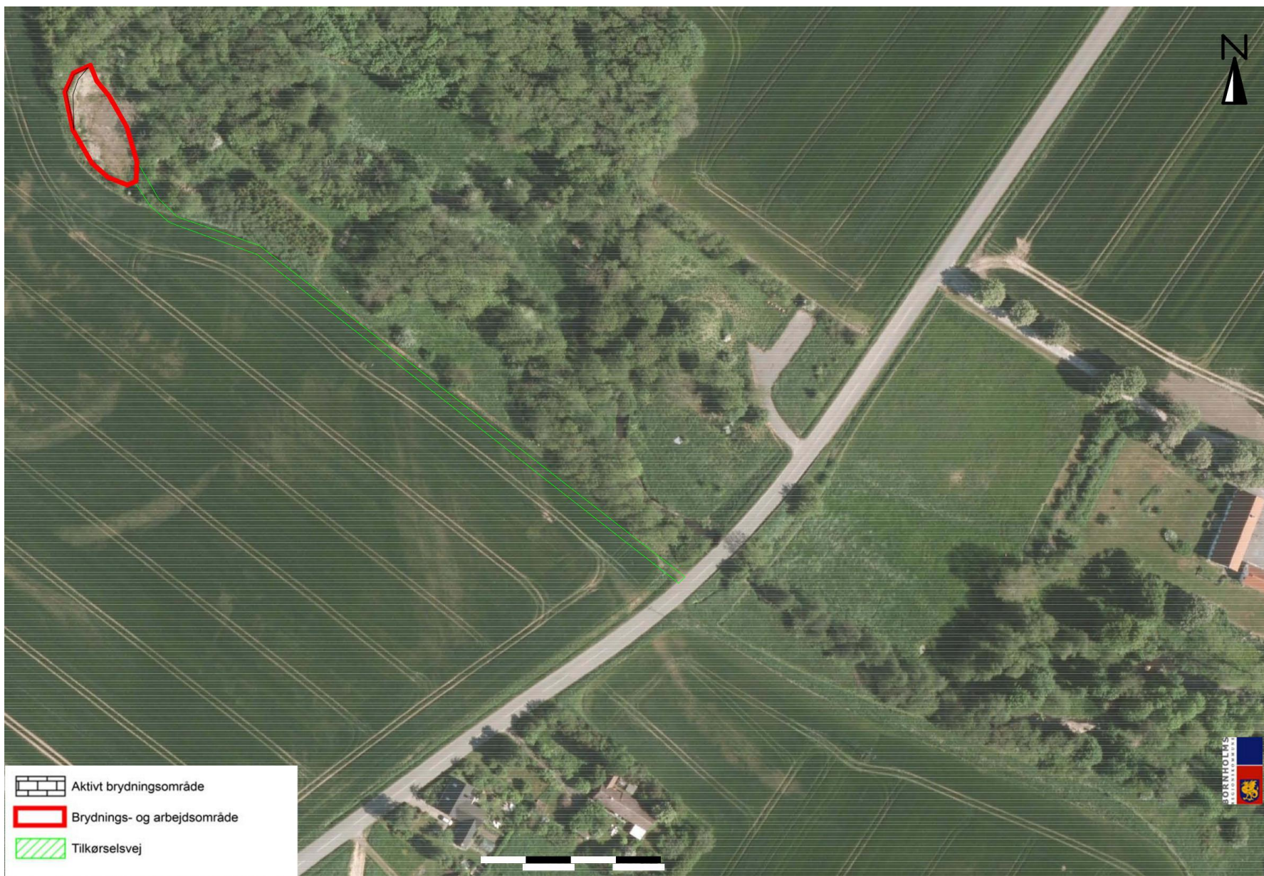
Kortbilag 1c – adgangsforshold (1:1500)