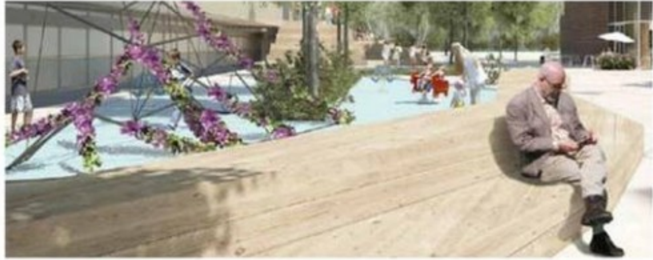
Forside / Presse / Nyt byrum på Frederiksberg skal forene unge, ældre og handicappede