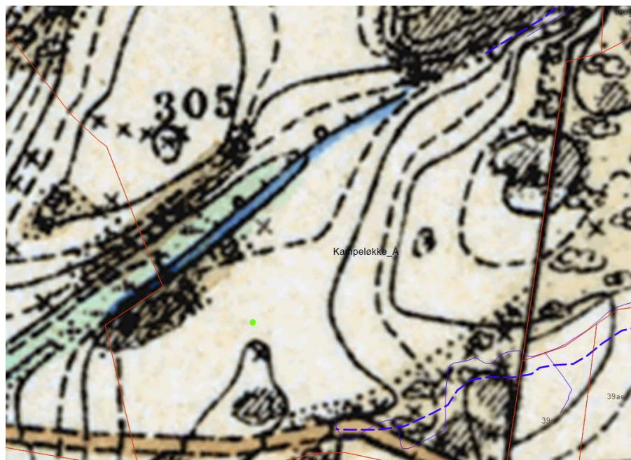
Figur 2: Generalstabens historiske kort (1883-1887) viser det åbne vandløbstrace (blå markering) i projektområdet.

Med projektet føres vandløbet tilbage til de historiske forhold, hvilket fremgår af Generalstabens Topografiske kort fra 1883-1887, hvor det åbne vandløb fremgår med en blå streg i projektområdet: