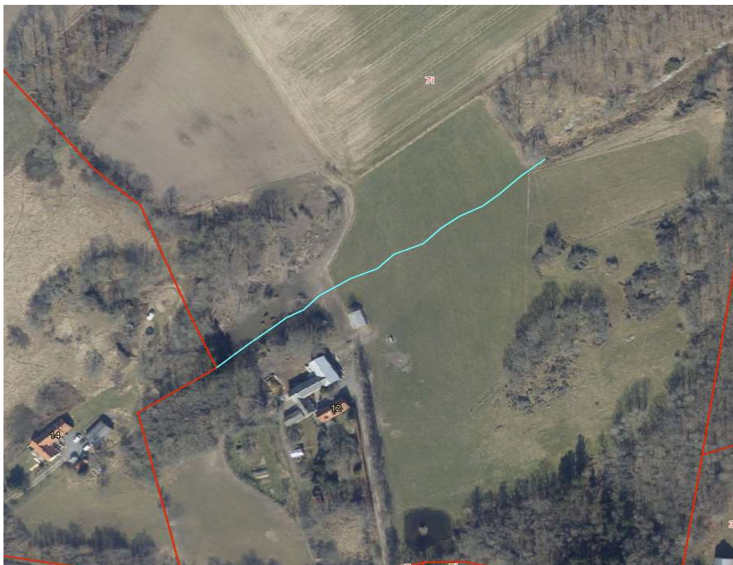
Figur 1: Kortet viser rørledningens placering (turkis streg).

Projektet foregår på 7i, Hovedejerlavet Olsker, der ligger vest for Olsker by. Følgende kort viser rørledningens placering og det fremtidige åbne vandløbs tracé: