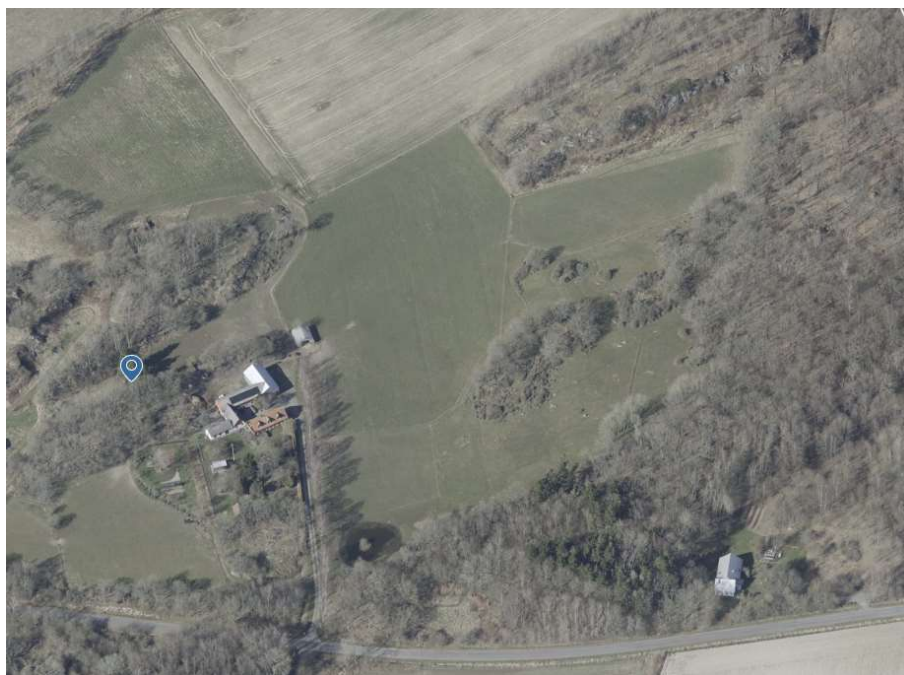
Figur 3: Satellitbillede af projektområdet.

Bornholms Regionskommune har foretaget en besigtigelse af projektområdet, i foråret 2023, sammen med ansøger. Det rørlagte vandløb ligger i et område med landbrugspligt, som ved besigtigelsen lå brak, og anvendt til græssende dyr. Følgende satellitbillede billeder viser projektområdet, hvor vandløbet skal genåbnes: