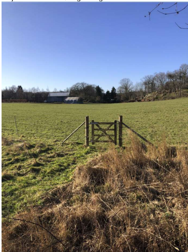
Projektområdet i nordøstlig retning: