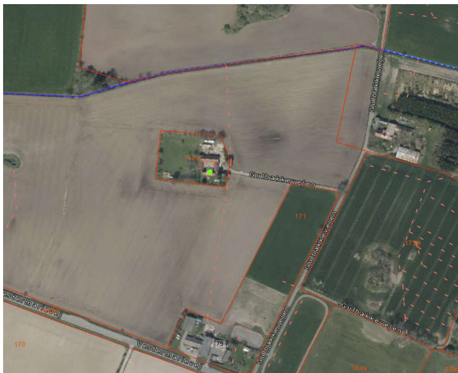
Figur 2: Matrikelkort, der viser drænet som projektområdet leder til (rød stiplede streg) og modtagende åbne vandløb (blå streg).

Drænet afvander matr. 171, Vestermarie mod syd og landbrugsarealet på matr. 114g, Vestermarie. Vandet ledes videre mod nord til det åbne naturlige vandløb "Tt. Læså i Vestre", som strømmer videre mod øst. Drænet og modtagende åbne vandløb fremgår af nedenstående kort: