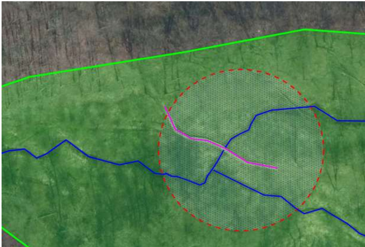
Figur 1: Oversigtskort, der viser broens placering (pink streg) og vandløbet som krydses (blå streg) (Kortinfo).

Gangbroen blev anlagt som led i etablering af et større stiprojekt i området. Stiprojektet blev anlagt, for at give borgerne i Vestermarie adgang til den omkringliggende natur. Stien forløber gennem Svineryggen og fungerer som en rundtur i to privatejede skove. Stiforløbet (stiplet blå streg) og gangbroens omtrentlige placering (rød cirkel), fremgår af følgende kort: