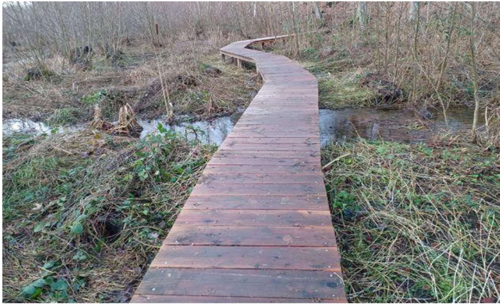
Figur 3: Billede af gangbroen, der krydser vandløbet, set mod øst.

Her ses et billede af gangbroen, der krydser vandløbet: