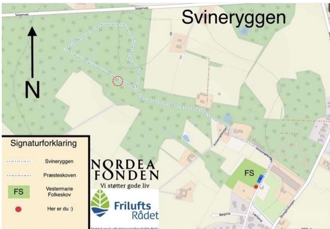
Figur 2: Kortet viser stien, med blå stiplet signatur, over Svineryggen. På kortet ses også lokationen for broen, som er anlagt langs vandløbet (rød stiplet cirkel).

Gangbroen blev anlagt som led i etablering af et større stiprojekt i området. Stiprojektet blev anlagt, for at give borgerne i Vestermarie adgang til den omkringliggende natur. Stien forløber gennem Svineryggen og fungerer som en rundtur i to privatejede skove. Stiforløbet (stiplet blå streg) og gangbroens omtrentlige placering (rød cirkel), fremgår af følgende kort: