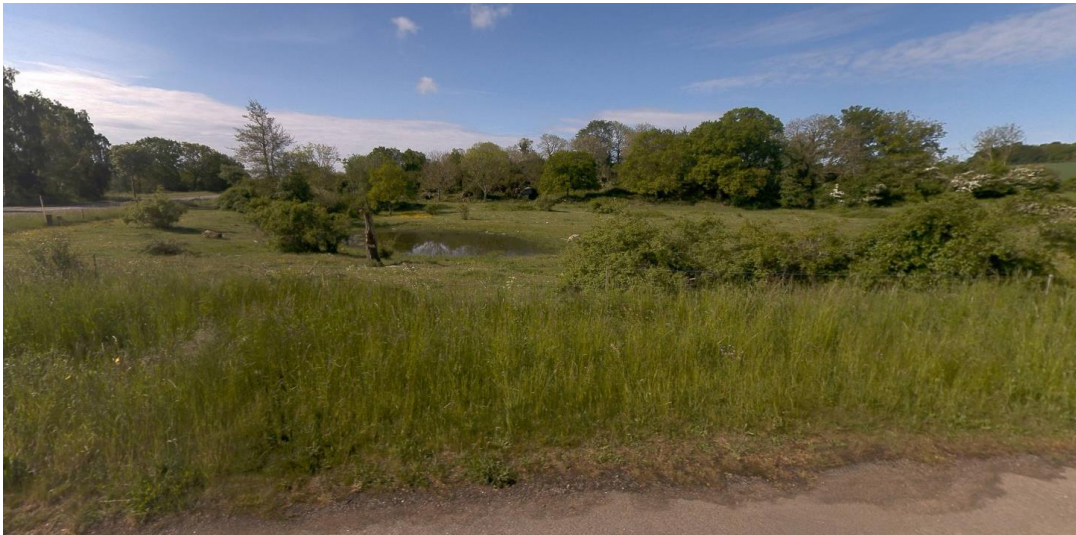
Tilsvarende efterbehandlet grusgrav syd for Nørregårdsvejen