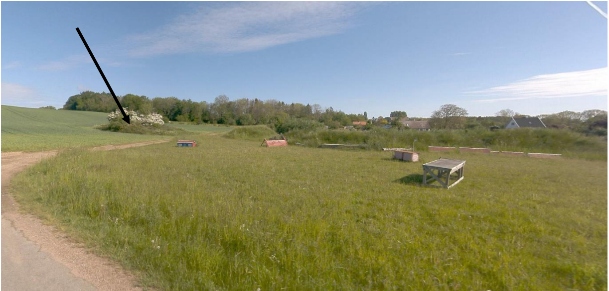
Indsigt til grusgravområdet fra Nørregårdsvejen. Fortidsmindet ligger i den lille kratbevoksning markeret med pil