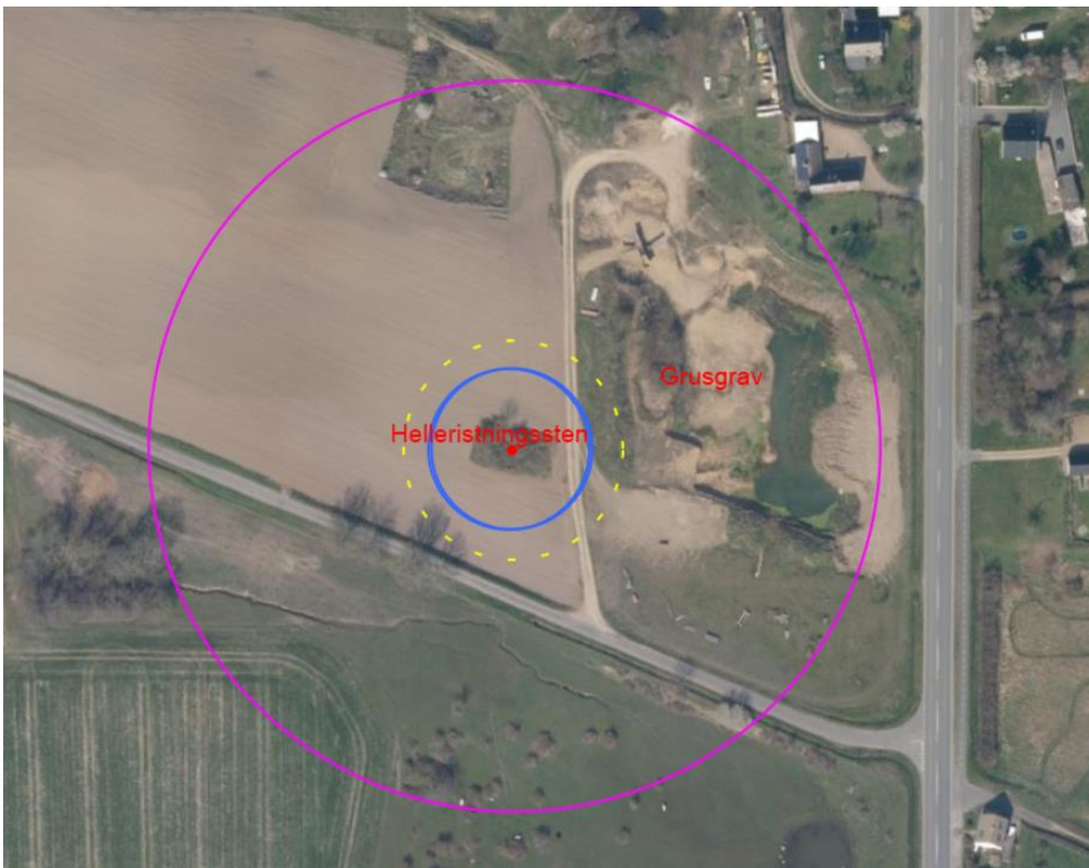
Oversigtskort – fortidsmindet markeret med rød prik. 100m beskyttelseslinjen er markeret med lyserød cirkel. 20m zonen med blå cirkel. 30m zonen fra tidligere tilladelse markeret med stiptet gul cirkel.