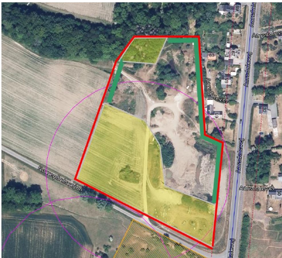
Bilag 3 fra ansøgningsmaterialet

Jeg kan se på luftfoto der med stor sandsynlighed er betydelige grus forekomster omkring (helt op ad) disse. Derfor vil gerne søge om dispensation til at grave væsentlig tættere på disse, gerne 5m.