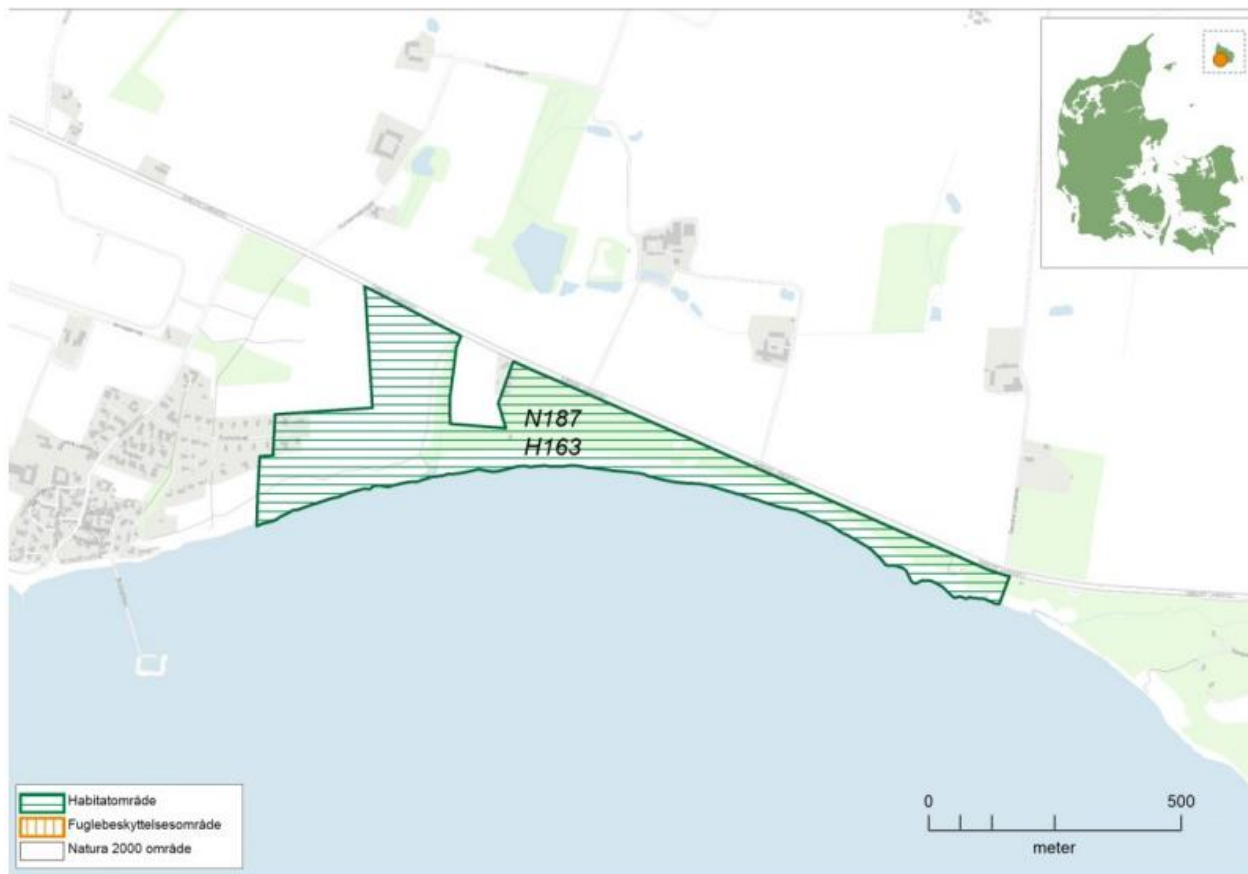
Figur 1 Kortet viser afgrænsningen af Natura 2000-område N187. Natura 2000-området består af habitatområde H163 (vandret grøn skrævering).

Handleplanen for N187 Kystskrænter ved Arnager Bugt beskriver den indsats, der skal igangsættes i Natura 2000-området inden udgangen af 2027. Natura 2000-området består af habitatområde H163 Kystskrænter ved Arnager Bugt. Området fremgår af nedenstående Figur 1.