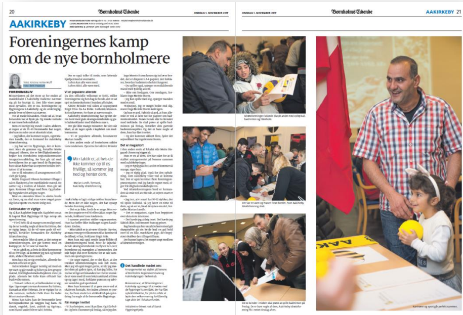
(Bornholms Tidende, 1. november 2017)

En mørk og våd tirsdag aften sidst i oktober mødte godt 100 mennesker op til Velkomst- og informationsmøde i Aakirkebyhallerne. Her stod det lokale foreningsliv klar til at møde de nye borgere i Aakirkeby, og svare på de spørgsmål, de måtte have omkring aktiviteterne og medlemskab.