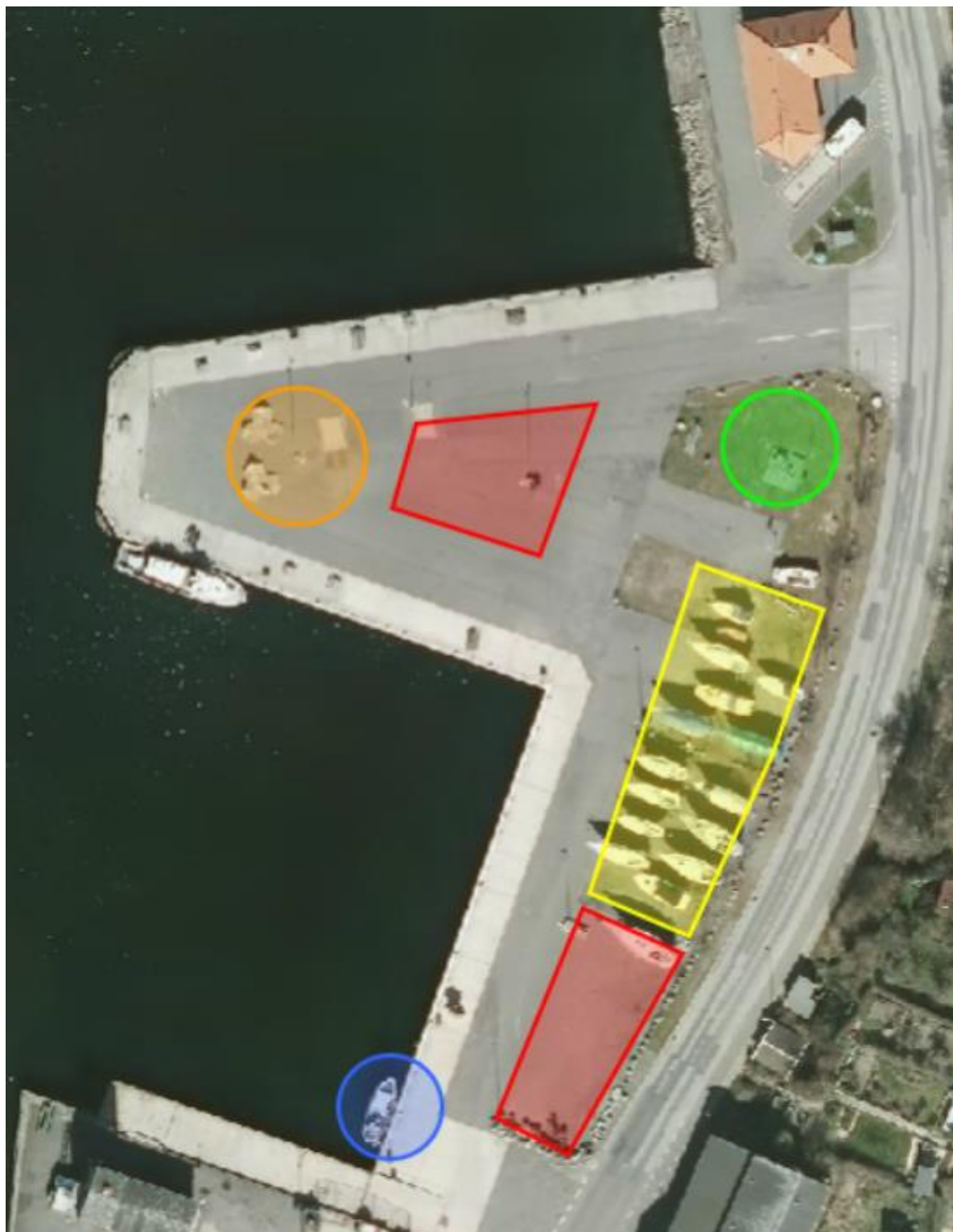
Kort 3 Havnens torv: Grøn cirkel = grillplads, blå cirkel = salg af fisk, røde firkanter = parkeringspladser, gul firkant = vinteropbevaring af både og sommerpladser til autocampere, orange cirkel = stodepladser

I området lige syd for havnekontoret er der et område, der kan betegnes som havnens torv (Kort 3), og hvor f.eks. Sildefesten afholdes hvert år. Området skal indrettes, så det i højere grad kan blive et rekreativt rum for både lokale og turister: