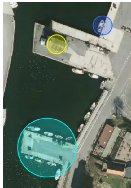
Kort 4 Fiskeriområde: Turkis cirkel = fiskerikaj, gul cirkel = kølehus og blå cirkel = salg af frisk fisk fra kutter

Anvendelsen af landarealet i den allersydligste og vestligste del af havnen rummer en række rekreative aktiviteter; strand, strandcafe, kajakroere, beachvolleybane, osv., og selve kanaløen bruges flittigt af hundeluffere og hobbyornitologer. Selve kanaløen er bilfri.